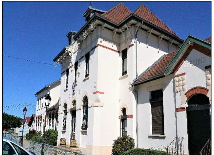
L'école a fait sa toilette d'été (voir encadré ci-dessous) pour accueillir enseignantes, Atsem et les 187 élèves prévus pour cette rentrée scolaire.