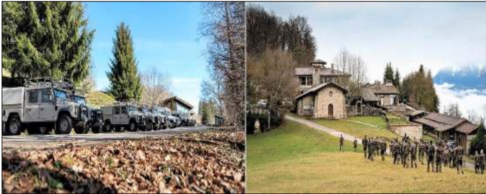
Le centre de Parménie a accueilli comme tous les ans, cette année du 20 janvier au 5 février, soixante militaires pour un stage de préparation à une mission à l'étranger.

[Infos & Photos gracieusement fournies par Guillaume Perrier, Directeur du Centre de Parménie]