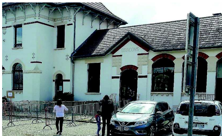
Gestes barrières, barrières, voici des dispositifs dont nous avons tous hâte de nous passer. Ici devant l'école ces barrières étaient encore nécessaires pour canaliser les élèves à l'entrée et la sortie des classes.

Quel casse-tête, cette réouverture de l'école ! D'un côté une équipe pédagogique qui devait jongler entre « présentiel » et « distanciel », ces nouveaux mots nés de la crise sanitaire, garantir l'accueil des enfants de soignants dès le début du confinement, sans parler de la garderie assurée par la commune. Dans chacune des trois, puis quatre classes ouvertes, officiaient une enseignante et une Atsem. Et tous les jours elles devaient pratiquer, lavage des mains, distanciation,