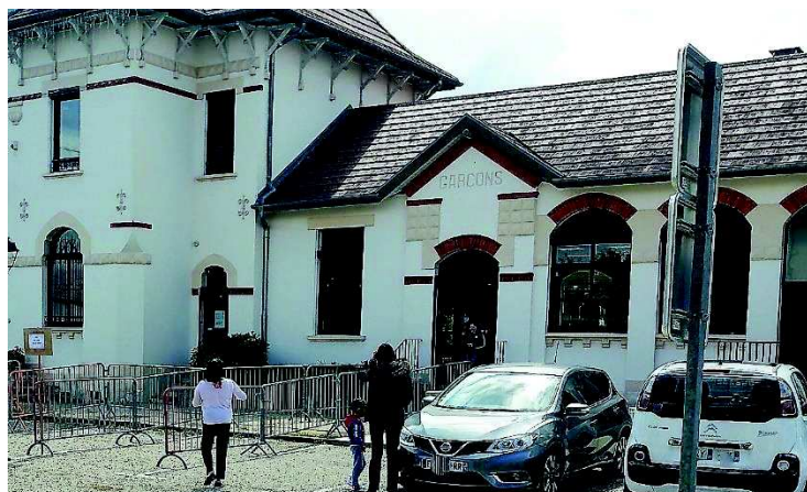
Gestes barrières, barrières, voici des dispositifs dont nous avons tous hâte de nous passer. Ici devant l'école ces barrières étaient encore nécessaires pour canaliser les élèves à l'entrée et la sortie des classes.

Bientôt l'été va permettre à chacun d'évacuer les tensions et les nouvelles sur l'évolution de la situation sanitaire laissent espérer une rentrée plus sereine.