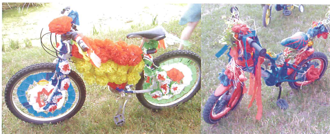
VELOS FLEURIS 14 JUILLET 2010