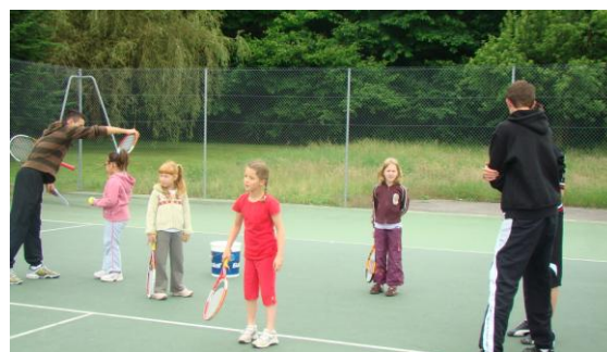
Enfants à l'école de tennis